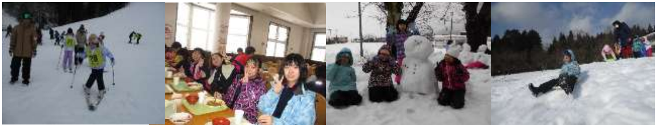
【とても楽しく、スキー教室や雪遊びを実施することができました！】

また、この積雪のおかげで、学校では、低学年が楽しく雪遊びを実施することができました。スキーや雪遊びのご準備、安全への配慮等、たくさんの方からご協力いただきましたことに、心より感謝申し上げます。