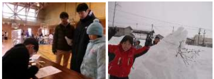
【大盛況だったスノーフェスティバル】

8日（土）には、猿沢・塩野町まちづくり協議会共催で、当校を会場にスノーフェスティバルが開催されました。地域の皆様が、主体的に雪とかかわる場を提供し、子どもたちと一緒に楽しまれている姿には、心より敬意を表します。当日は岩船地域に波浪警報が出るほどで、屋外での活動は難しいかなと感じましたが、何人かの子どもたちが、元気よく雪像の背中滑りやそり遊びを楽しんでいました。地域の担い手として育つ子どもたちにとって、大切な行事であることを感じた一コマでした。